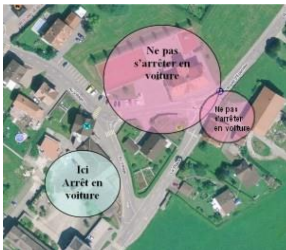
Arconciel derrière le restaurant UNIQUEMENT

Les enfants qui seraient amenés en voiture pour des raisons indispensables doivent impérativement être déposés dans les parkings autorisés pour chaque école.