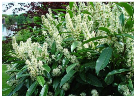
6m H; Feuilles persistantes, coriaces, vertes foncées quasi plastifiées, fleurs blanches en capitule