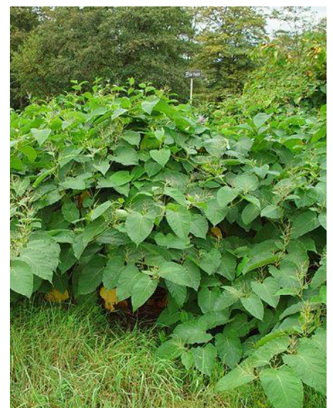
1-3m H; Tiges creuses, rouges. Forme un zigzag d'une feuille à l'autre, grandes feuilles ovales à pointues, fleurs blanches en grappe